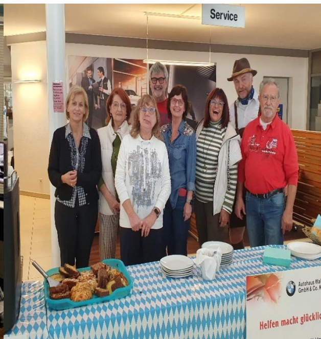
Team am Sonntag