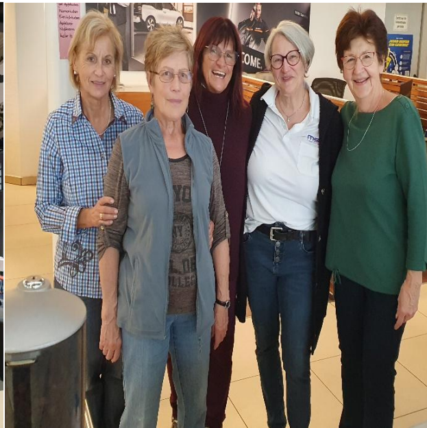
Team am Samstag